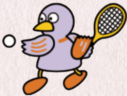
埼玉県のマスコット「コバトン」