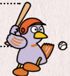
埼玉県のマスコット「コバトン」