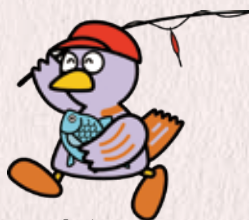
埼玉県のマスコット「コバトン」