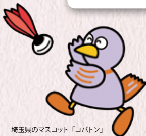
埼玉県のマスコット「コバトン」