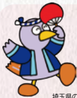
埼玉県のマスコット「コバトン」